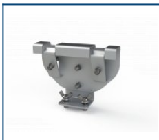
Кронштейн на трос Unit (комплект)